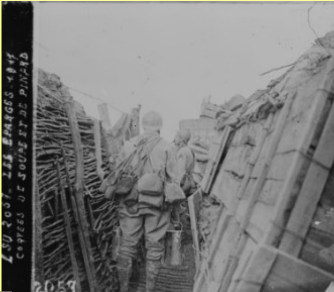
Archives de la Marne, 39 Fi 53