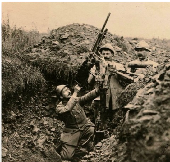
Mitrailleuses Hotchkiss françaises Archives de la Marne, 23 Fi 8/2

Lorsqu'éclate la guerre en 1914, les états-majors envisagent une guerre « traditionnelle », c'est-à-dire un conflit de courte durée ponctué de quelques grandes batailles où le vainqueur sera celui qui disposera du plus grand nombre d'hommes donc de fusils. La mitrailleuse va totalement changer la donne et imposer une nouvelle forme de combat. Dès 1914, la bataille des frontières, et aussi le plan Schlieffen, voient les armées française et allemande s'engager dans l'offensive conformément à la stratégie en vigueur. Les premières batailles se révèlent particulièrement mortifères. Les fantassins des deux camps se font littéralement hacher par les mitrailleuses. Les trois premiers mois du conflit voient l'armée française perdre 450 000 hommes (soit une moyenne mensuelle deux fois plus élevée que pour la bataille de Verdun). Incapables d'avancer, les combattants cherchent à se protéger des rafales tirées par les Maxim et les Hotchkiss . Leur meilleure option est alors de s'enterrer pour survivre. Les hommes creusent donc des trous individuels et se figent sur leurs positions. Peu à peu, ces trous sont agrandis et reliés entre eux. La première guerre mondiale entre pour trois ans dans la guerre de tranchées.