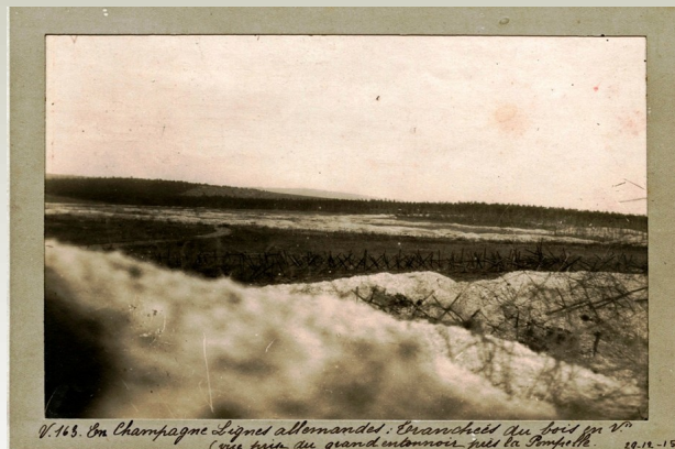
V. 143. En Champagne. Lignes allemandes. Tranchées au bord du N° C'est près du grand entonnoir près de Sommeville. 29.12.15.

Cette photographie, prise près de Reims, illustre parfaitement le paysage de la guerre de tranchées. Le sol champenois, composé de craie, permet d'identifier les zones creusées par les combattants. Au premier plan on devine la tranchée française protégée par un réseau de barbelés. Au deuxième plan se trouve le no man's land. Au troisième plan on devine le réseau de défense allemand, c'est-à-dire une tranchée de première ligne mais aussi une tranchée de seconde ligne. Enfin, en arrière-plan et se perdant dans la forêt, on devine un boyau qui permet d'acheminer les hommes et le matériel de l'arrière-front à la zone de combat.