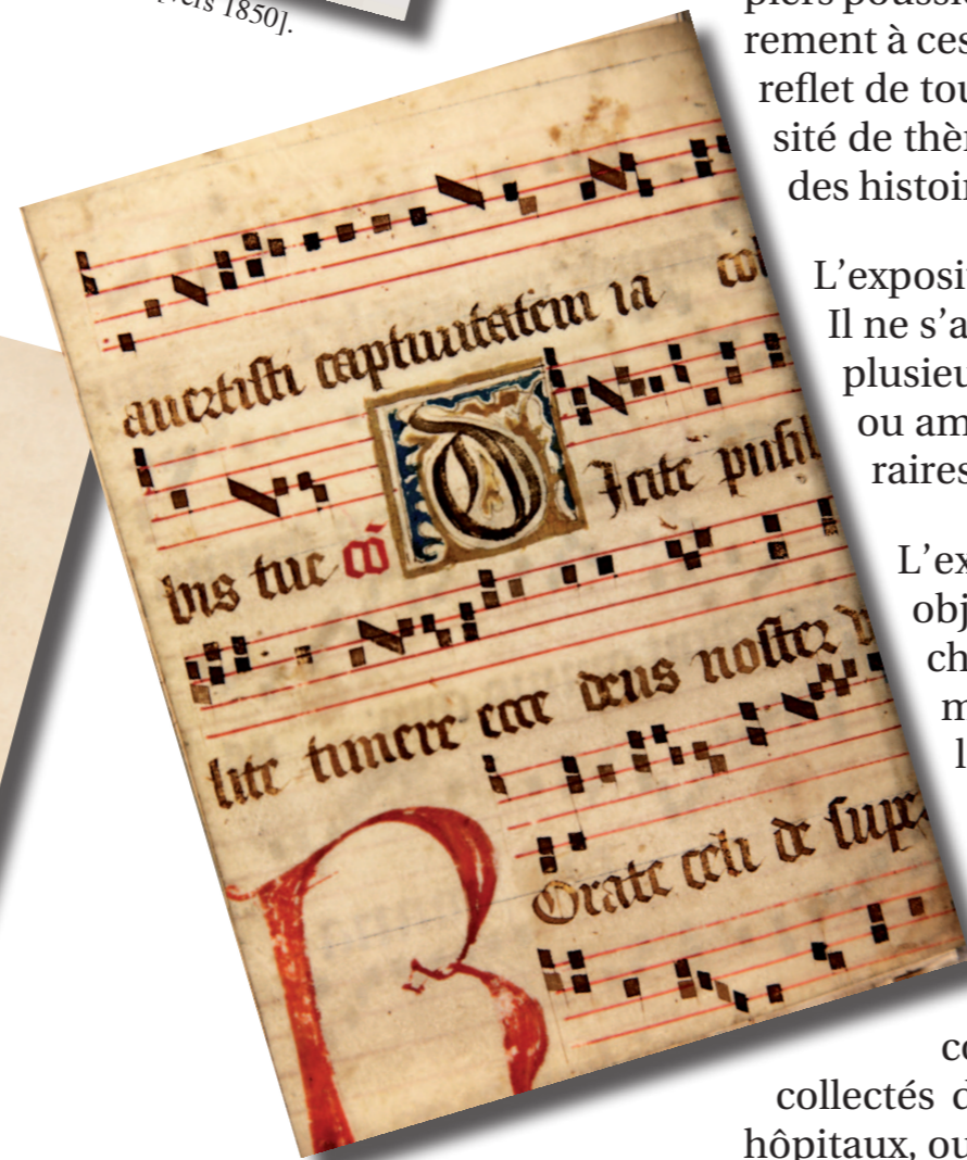
Registre paroissial de la commune de Saint-Gibrien, 1699-1704.