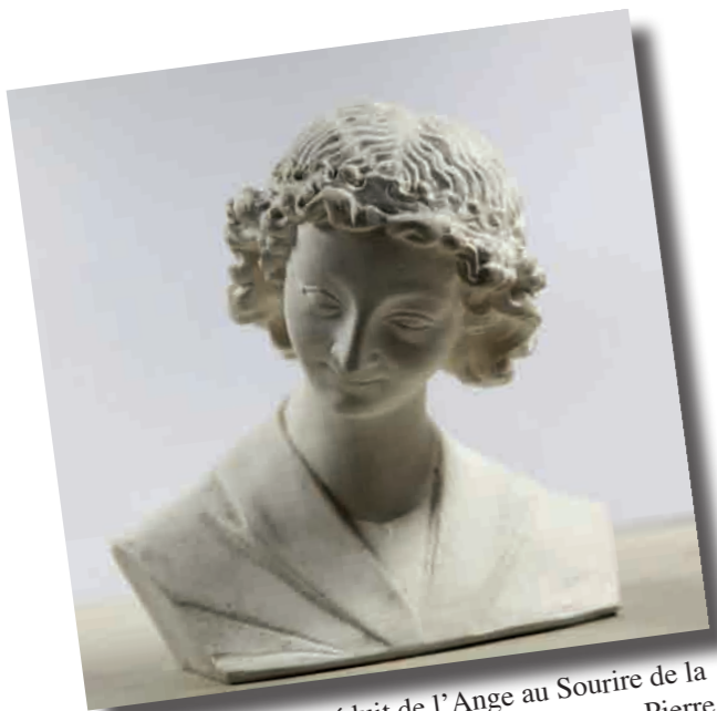
Modèle de buste réduit de l'Ange au Sourire de la cathédrale de Reims, réalisé par le sculpteur Pierre Berton en 1932 (droits réservés).