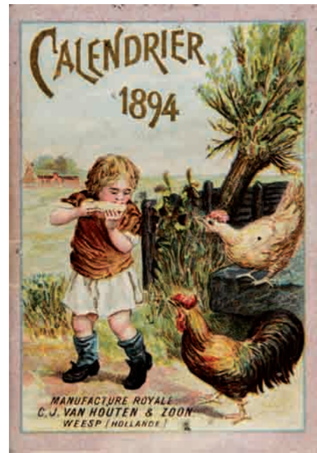
Calendrier publicitaire, 1894.