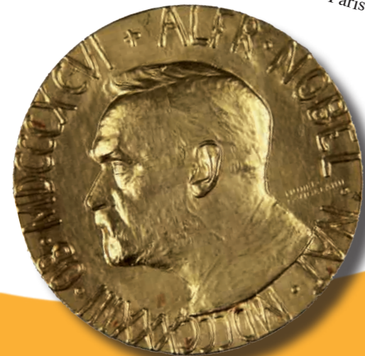
Prix Nobel de la Paix décerné à Léon Bourgeois en 1920.