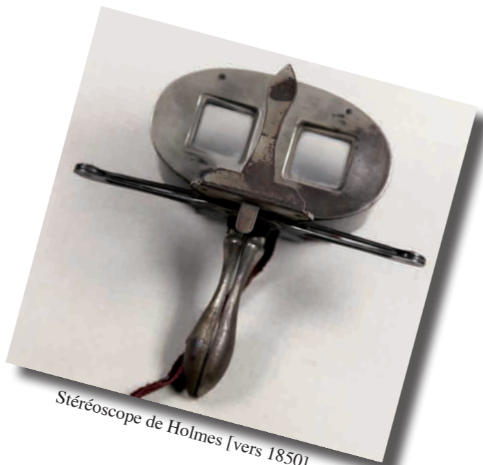
Stéréoscope de Holmes [vers 1850].