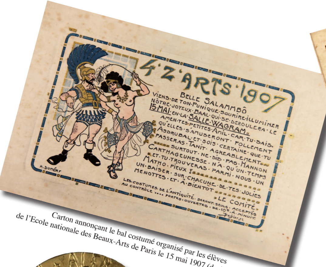
Carton annonçant le bal costumé organisé par les élèves de l'Ecole nationale des Beaux-Arts de Paris le 15 mai 1907.

L'exposition présente environ 150 documents et objets, qui sont tous issus des collections des Archives départementales de la Marne (27 kilomètres linéaires de documents) et sont, pour la plupart, présentés pour la première fois. Il s'agit principalement d'archives privées, que l'on dit entrées « par voie extraordinaire » dans le jargon archivistique, et qui proviennent de dons, dépôts ou achats. Ces documents viennent compléter et enrichir les fonds publics collectés dans les administrations, communes, hôpitaux, ou chez les notaires.